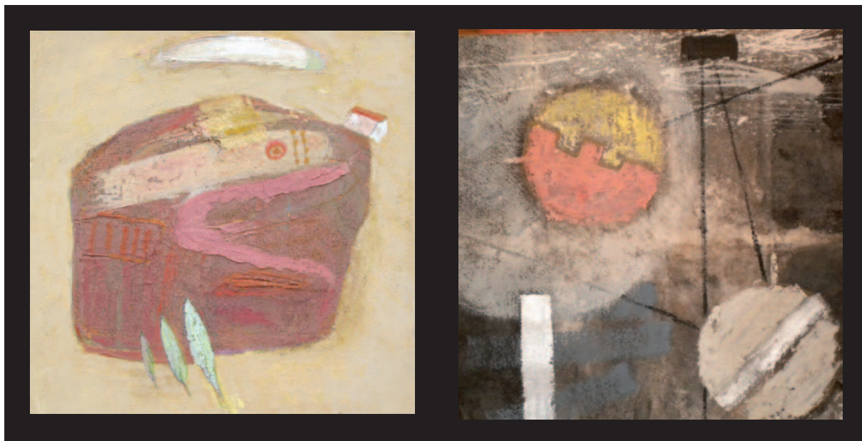
Giovanni Fabbri, In bilico - Guerrino Siroli, Tutto tondo